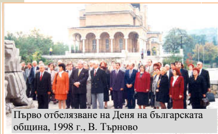
Първо отбелязване на Деня на българската община, 1998 г., В. Търново