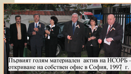
Първият голям материален актив на НСОРБ – откриване на собствен офис в София, 1997 г.

Нашата история започна на 11 декември 1996 г., когато 94 общини поставиха началото на Националното сдружение на общините в България.