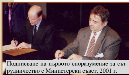
Подписване на първото споразумение за сътрудничество с Министерски съвет, 2001 г.