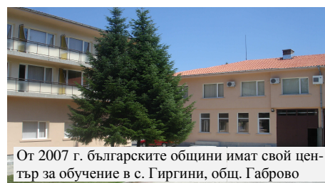
От 2007 г. българските общини имат свой център за обучение в с. Гиргини, общ. Габрово

Честит празник на българските общини и на всички, свързани с каузата на НСОРБ!