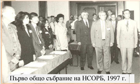
Първо общо събрание на НСОРБ, 1997 г.