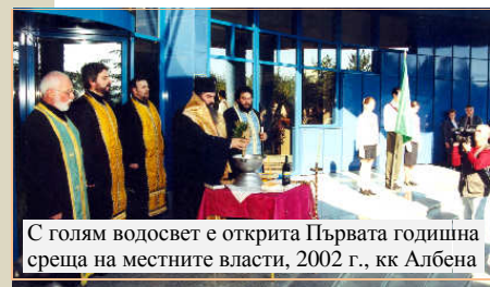
С голям водосвет е открита Първата годишна среща на местните власти, 2002 г., кк Албена